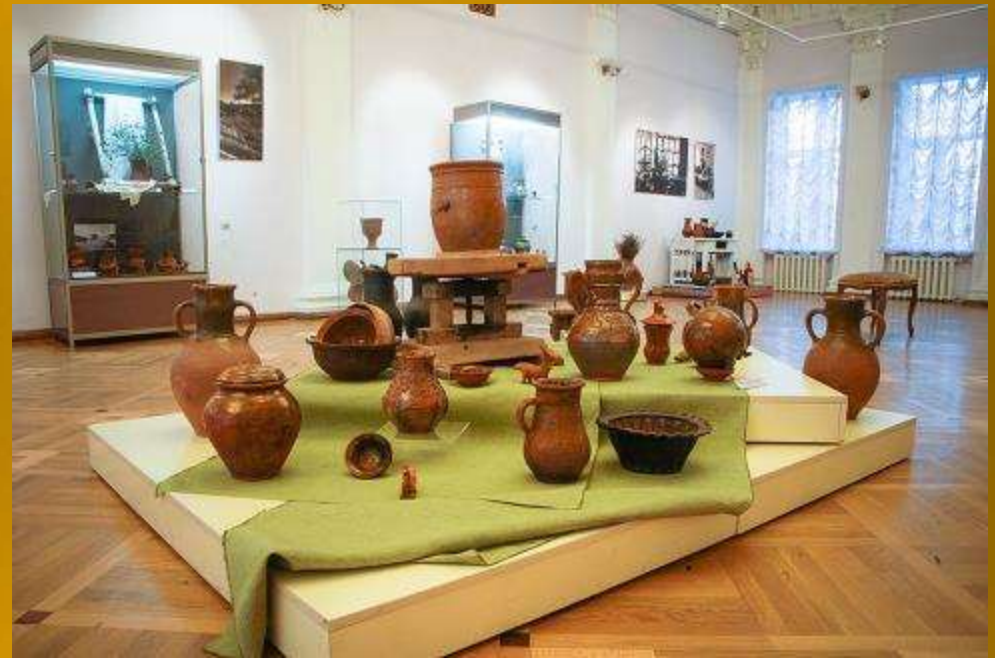
Тамбовский краеведческий музей