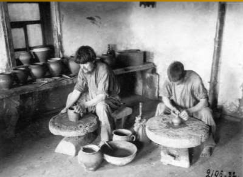
Жердевский, Моршанский, Мучкапский районы, г. Тамбов