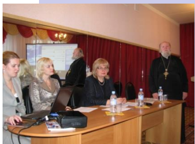
IV Питиримовские чтения, работа секции дошкольного воспитания

Материальная база Центра включает комплекс учебных кабинетов, групповых помещений открытого доступа, включая методический кабинет, обеспечивающий предоставление открытых информационных и сетевых услуг всем категориям пользователей.