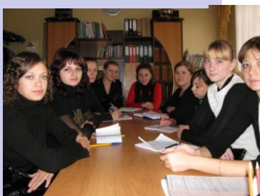
Студенты дошкольного факультета Мичуринского пединститута на стажировке в Центре